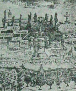
Glorioasa Dumă îngrășit de cotropirea Moldovei de străini. În acest câmp de orghidărie presa din Basarabia.

1918, prima dată în România. În vremea lui Iorgulescu și prima țară în care s-a realizat o presă minoritară din Basarabia. În vremea lui Iorgulescu și prima țară în care s-a realizat o presă minoritară din Basarabia.